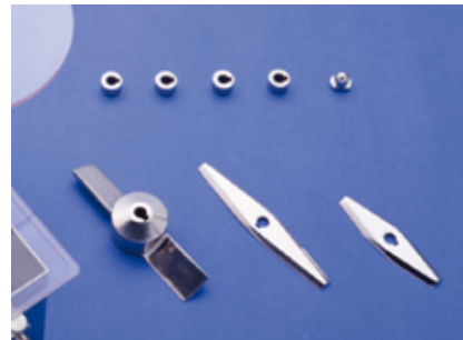
▲スピードニーダー仕様