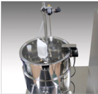
▲スプレーガン装着